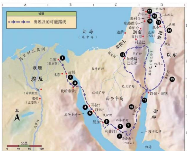
2. 以色列人出埃及和进入迦南地

在亚喀巴机场等待了 3 个多小时后，我们终于被重新安排上了飞机，再次起飞！心情无比激动！但是得益于这次晚点，我们得以在晴朗的天空下鸟瞰死海全貌，也是上主额外的恩典吧！