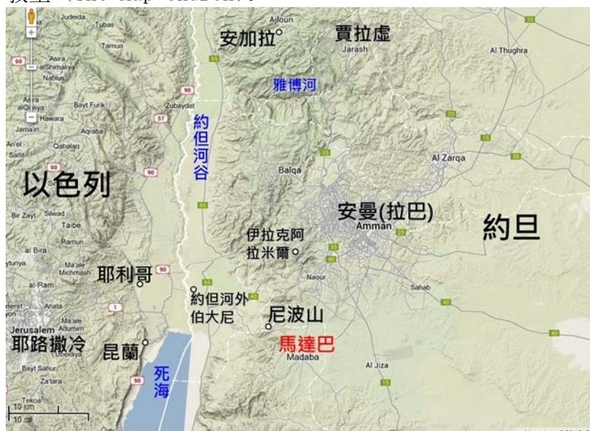
米底巴/马达巴 (Madaba)

在餐馆旁边步行 5 分钟，就到了一所更加古老的教堂——米底巴基督教古城教堂，米底巴的地图教堂 (The Map Church)。