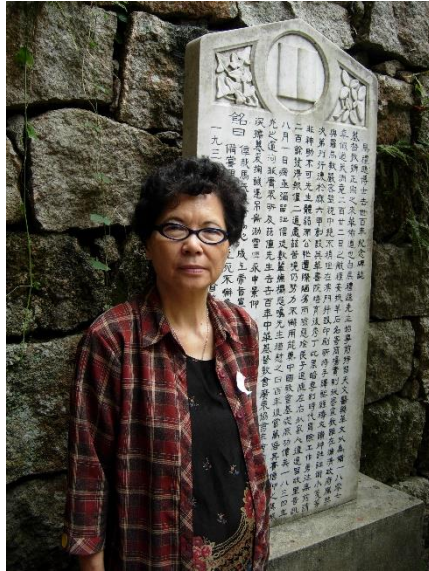
妈妈在澳门马礼逊墓前