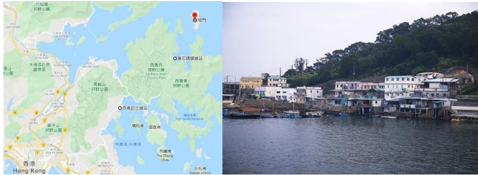
位于香港新界东北的塔门岛

我对初一、十五的印象非常深刻，因为我小时候已对初一十五留下深刻的印象。大家也知道我的家乡是西贡大浪村，其实我还有一个第二家乡，因为我小时候曾经在塔门居住，我的爷爷是中医师，在塔门开了药材铺，我小学3年级曾住在塔门，在塔门继续读书。