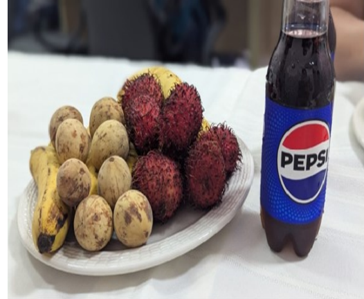
发射站的同工更预备了汽水及时令水果