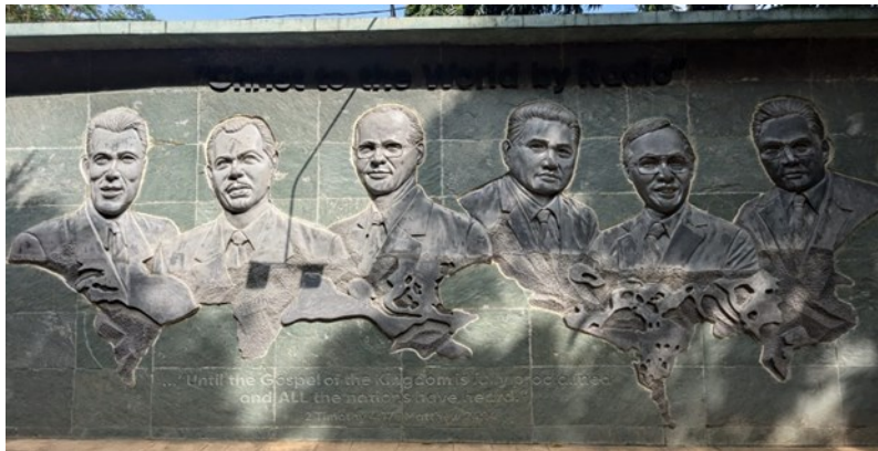
The Pioneer's Wall(直译：“先驱者之墙”，这是福音广播的创始人)

当我们打开收音机，随意地收听着电台在不同时段，却又能顺序按时地播出节目内容，我们可曾想过，背后有多少人为这些节目付出，为我们的生活默默地工作？