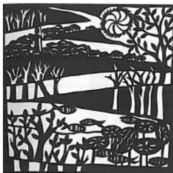
诗 (Psalms 23: 1-3)

这本剪纸作品集共分两部份。第一部份〈作品一〉以新旧约圣经中记述的人物片段作为主题，也有以“门徒系列”、“沉思系列”、“论语系列”、“圣经系列”作为副题的专题黑白剪纸，风格刚挺。第二部份〈作品二〉展示彩色剪纸，格调活泼明快，构图表达出作者的神学思想，其中有我喜欢的“耶稣高兴的时刻”。〈作品二〉中也有“苦路系列”、“使徒行传”，其中还夹杂了一些天主教的记述，如“苦路系列”第六站出现的人物。